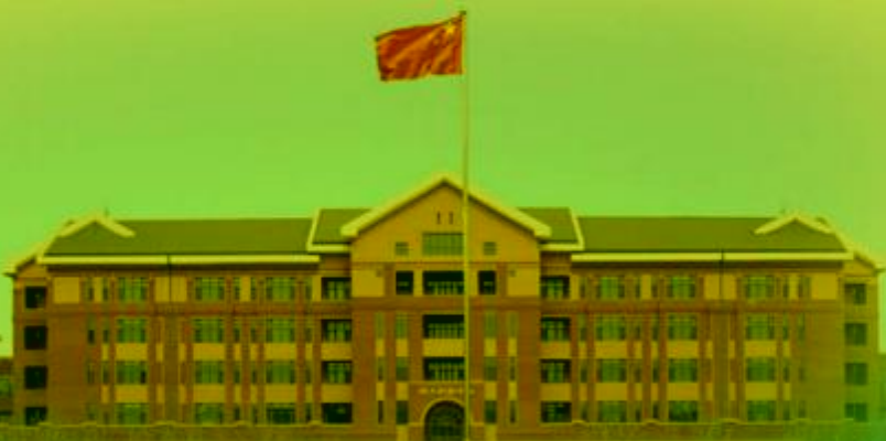
天津机电职业技术学院

TIANJIN VOCATIONAL COLLEGE OF MECHANICAL AND ELECTRICAL ENGINEERING